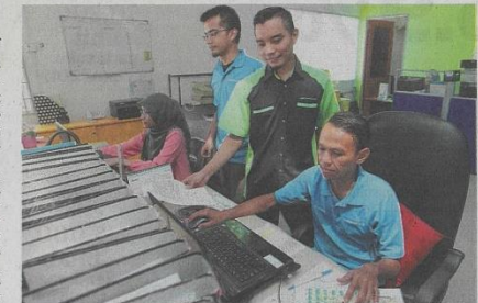
PERTUMBUHAN dalam pasaran buruh dan pekerjaan yang lebih tinggi membuktikan ekonomi Malaysia semakin baik. - GAMBAR HIASAN

"Secara keseluruhan, kadar purata pengangguran di seluruh dunia menunjukkan pasaran bu-